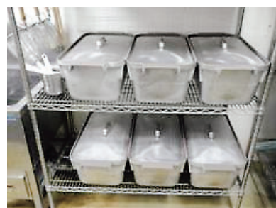
医大病院の御飯の炊飯釜です。 1つで約70人分炊けます。

患者さんに、おいしいとって食べてもらえるよう栄養士も、調理師も日々精進を重ねています。今後も、医大病院は三度三度の御飯を心を込めて丁寧につけてまいります。