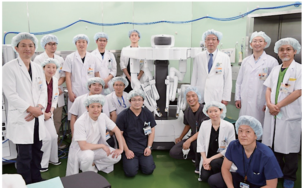
消化管外科メンバーとダヴィンチXi

更に、令和3年10月に当院では「ダヴィンチ」システムの最新鋭版であるXiとXの2機種へと機器を更新しました。前世代の機器に比べ機能が充実し、より複雑で難しい手術に対する低侵襲手術の提供が可能となりました。今後さらなるロボット支援手術を発展させることで、低侵襲で精緻な治療技術を提供してまいります。