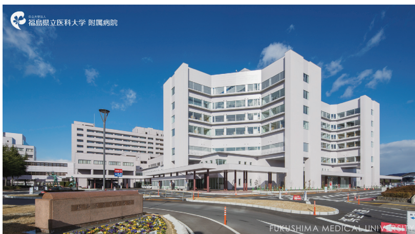
当院全景。福島県における中核的な医療機関として、努力と研鑽を続けて参ります。

当院の約650名の医師、約950名の看護師、約600名の技師、事務職員等、全ての職員が、心と力を合わせて患者さん一人ひとりに心の通い合う医療を提供することができるよう、今後も引き続き努力と研鑽を続けて参りますので、どうぞよろしくお願い致します。