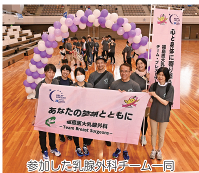
参加した乳腺外科チーム一同

に残るのが、参加者一人一人の笑顔です。「がんは24時間眠らない」「がん患者は24時間闘っている」この活動の根幹にある言葉ですが、同じ病気の方やたくさんの支援者の方々との出会いや繋がりがこの笑顔の連鎖を生み出しているのだと思います。「がん患者さんを決して一人にさせない」医療従事者として、支援者の一人として、自分にできることは何か、患者さんに希望の光を届けることができるか、そのような思いを再認識する1日でした。