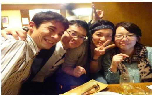
写真3) 日本人医師・研究者と一緒に (日本式居酒屋にて atNY)。