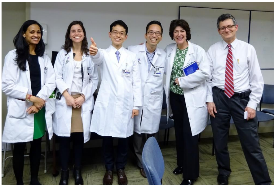
写真1) 柳澤先生と内分泌糖尿病内科の先生方と一緒に。