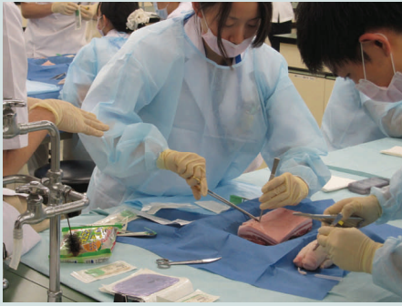
第4回 Surgical Skill Training (2009/11/10)