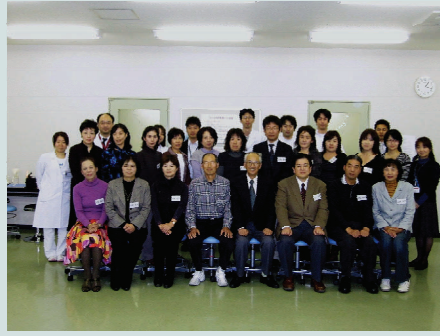
福島医大模擬患者(SP)さん養成会修了式 (2009/11/10)