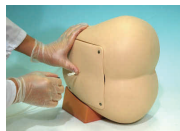
腰椎・硬膜外穿刺シミュレータ