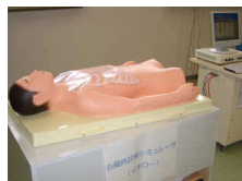
心臓病シミュレータ イチロー