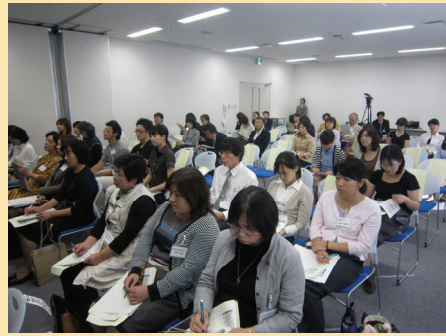
模擬患者さんレベルアップセミナー in 東北 2010 (2010/10/16)