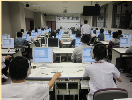
第6回 English Communication Skill Seminar (2010/10/05)