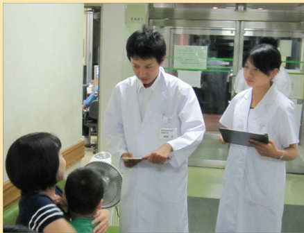
医療福祉・体験プログラム (産科・小児科医師密着プログラム) (2010/08/11)