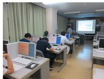
ステップアップセミナーの様子