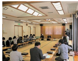
医療従事者との意見交換