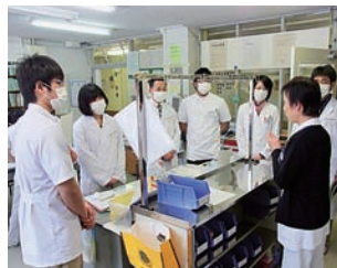
へき地拠点病院視察