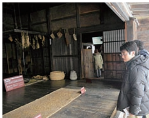
野口英世記念館見学