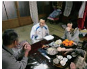
おいてけぼり研修